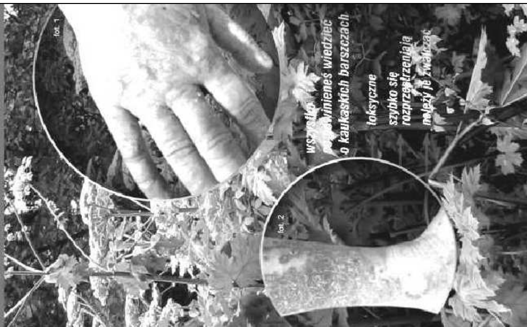
Wojewódzki Inspektorat Ochrony Środowiska w Warszawie, 2016 r.