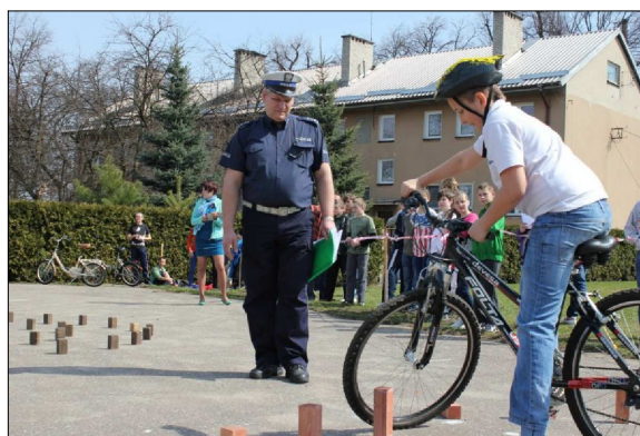
Jazda rowerem po torze sprawnościowym