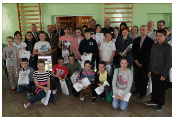
Uczestnicy konkursu ze szkół podstawowych