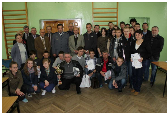
Uczestnicy konkursu z gimnazjów

Biuletyn Informacyjny Gminy Sterdyń – wydawca: Urząd Gminy, 08-320 Sterdyń, ul. Kościuszki 6, tel. 025-787-00-04.