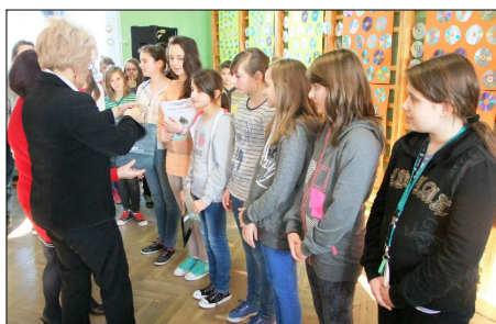
Laureaci konkursu matematycznego ze Szkoły Podstawowej