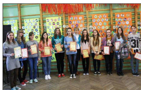
Laureaci konkursu matematycznego ze Szkoły Podstawowej