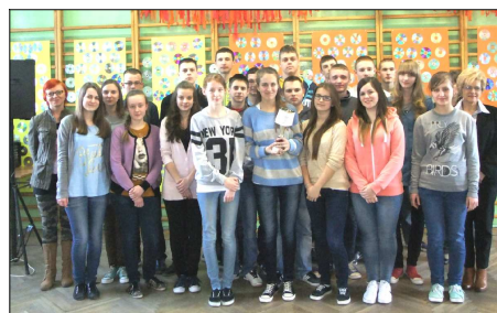
Klasa IIIb - najlepsza klasa Gimnazjum