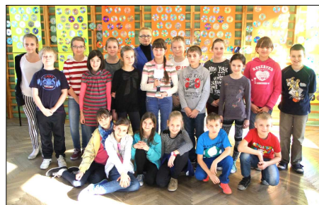
Klasa IV - najlepsza klasa Szkoły Podstawowej

Satysfakcjonujące jest to, że uczniowie sterdyńskiej szkoły osiągają znaczące sukcesy w dziedzinie biologii oraz ekologii i godnie promują szkołę.